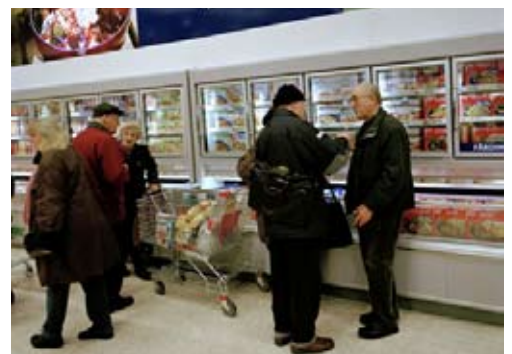
Axfood AB bedriver detaljhandel med de helägda butikskedjorna Hemköp, Willys och Willys hemma, cirka 220 butiker, samt partihandel inom Dagab och Axfood Närlivs. I samband med strukturella förändringar där det krävs överskådligt beslutsunderlag tar företaget hjälp av SolenWeb Portal.

– Om man ska etablera, förvärva eller genomföra andra strukturåtgärder gäller det att ha gott om fakta och ett tydligt geografiskt underlag. Det är svårt att bilda sig en uppfattning när man bara läser en text. Vi behöver också en bra karta – och det får vi genom SolenWeb Portal.